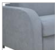
SILVIUM cm. 20