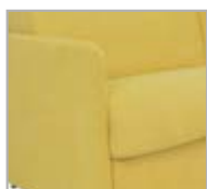
TORONTO cm. 5