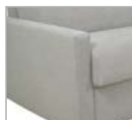
PARIGI cm. 7