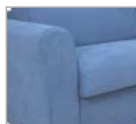
VELOX cm. 22